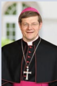
Stephan Burger Erzbischof der Erzdiözese Freiburg